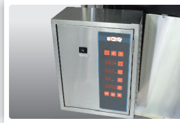
3 智能控制面板 烘烤温度准确可控