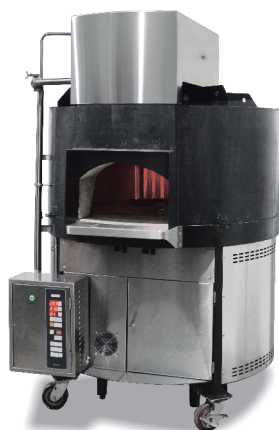
旋转石窑披萨焗炉 CPO-120RX-E