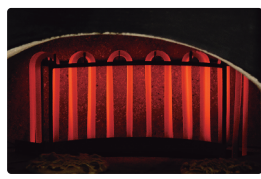
2 红外线铬支发热线 确保高效力输出