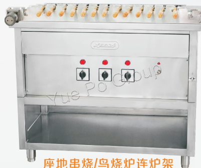
座地串烧/鸟烧炉连炉架 YA-100W + YA-10WS + YA-10WAR